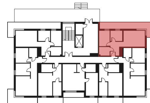
Rzut kondygnacji - PARTER