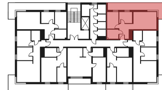
Rzut kondygnacji - 2 PIĘTRO