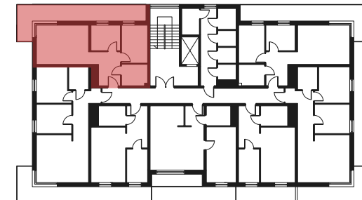
Rzut kondygnacji - 2 PIĘTRO