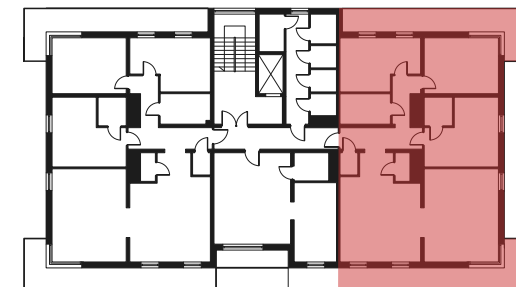
Rzut kondygnacji - 6 PIĘTRO