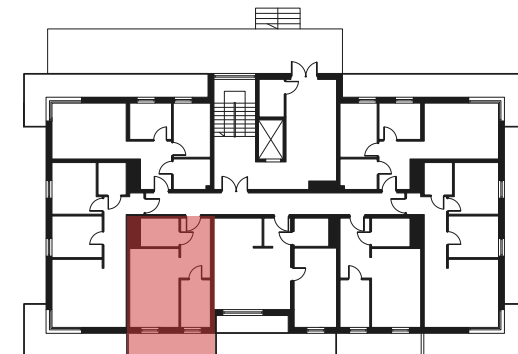
Rzut kondygnacji - PARTER